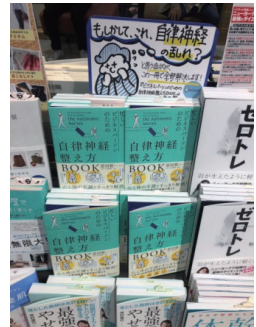
Y書店 アトレ目黒店様